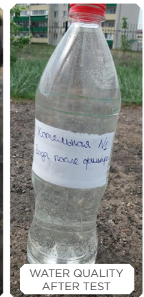
WATER QUALITY AFTER TEST