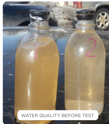
WATER QUALITY BEFORE TEST